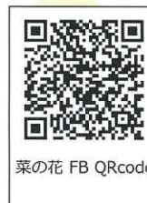
菜の花 FB QRcode

生活基礎講座では、公共交通機関の利用方法や日常生活に必要な買い物や調理などの体験を行います。また、利用者自治会「菜の花畑」では、自分たちで行先を決めて旅行に行くなど主体的に運営をしています。